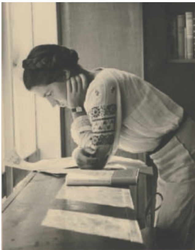
Jeanne Hersch, 1936

Le titre «Le temps vécu» est parfaitement caractéristique de la personnalité de Jeanne Hersch. Pour cette philosophe née en 1910, vivre vraiment son temps n'était possible que moyennant une activité réelle, concrète, pleinement assumée et réfléchie, et une décision délibérée d'influencer positivement les choses – dans le présent, ici et maintenant. Une conviction à laquelle Jeanne Hersch est demeurée fidèle jusqu'à sa mort en l'an 2000.