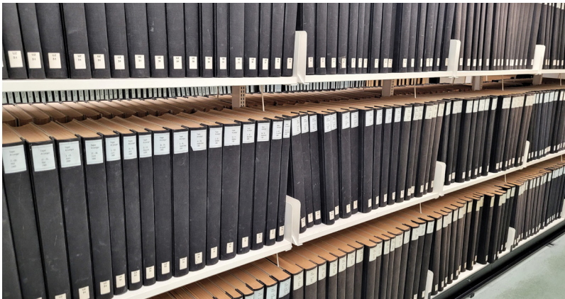
Gebundene Zeitungsbinden in der ZB Zürich

Mehr Informationen zum Citizen Science-Projekt: https://waswarbekannt.ch