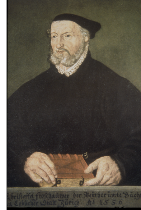
Christoph Froschauer, Porträt von 1556, Privatbesitz.