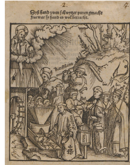
Martin Seger und Hans Füssli, Die Göttliche Mühle, Zürich 1521.