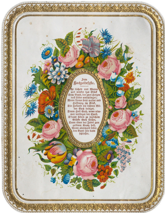
Hochzeitgedicht aus einer Sammlung von Glückwunschkarten von 1832–1932.

Zum Jahresende wird es romantisch in der ZB: Die Hochzeitsglocken läuten! Gemeinsam gehen wir auf Spurensuche und entdecken in liebevollen Briefen, witzigen Gedichten und nostalgischen Fotoalben, wie der schönste Tag im Leben seine Spuren in unseren Nachlässen und Familienarchiven hinterlassen hat.