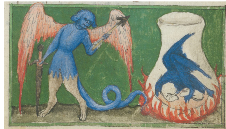
Illustration aus der alchemistischen Handschrift Ms. Rh. 172, 15. Jahrhundert.

Wissenschaft oder Zauberkunst? – Alchemistische Abhandlungen und besonders die geheimnisvollen und oft schwer zu entschlüsselnden Abbildungen faszinieren uns bis heute. Wir zeigen Ihnen bedeutende alchemistische Handschriften und seltene alte Drucke.