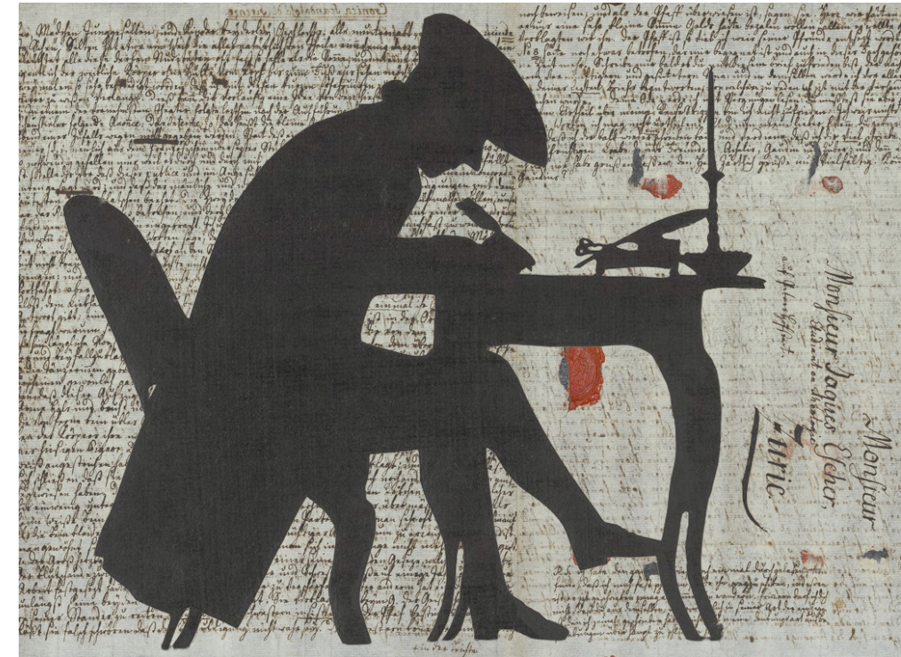
Montage aus: vermutlich Antoinette Lisette Fäsi (1730–1808): Lavater am Schreibpult, Scherenschnitt, und Brief aus dem Familienarchiv Hirzel, Ende 18. Jahrhundert.