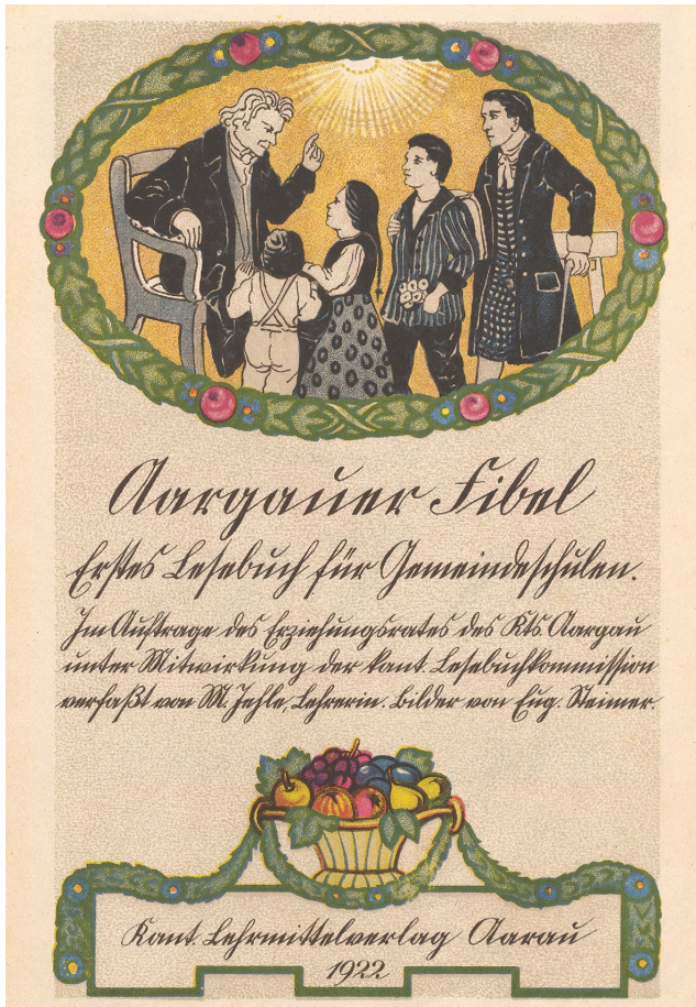
Abb. oben: Titel der «Aargauer Fibel» von 1922 in Kurrentschrift

Briefe des 19. oder gar 18. Jahrhunderts zu lesen, fällt uns oft schwer: «Schuld» daran ist meist die altertümliche, heute nicht mehr gebräuchliche «Kurrent-Schrift» oder «deutsche Schreibschrift». In der deutschsprachigen Schweiz war die Kurrentschrift parallel zu der uns vertrauten «Schnüerli-schrift» über Hunderte von Jahren bis zum Beginn des 20. Jahrhunderts in Gebrauch. Eine eng verwandte, aber etwas andere Schriftart, die «Sütterlin-schrift», gab es dagegen nur in Deutschland.