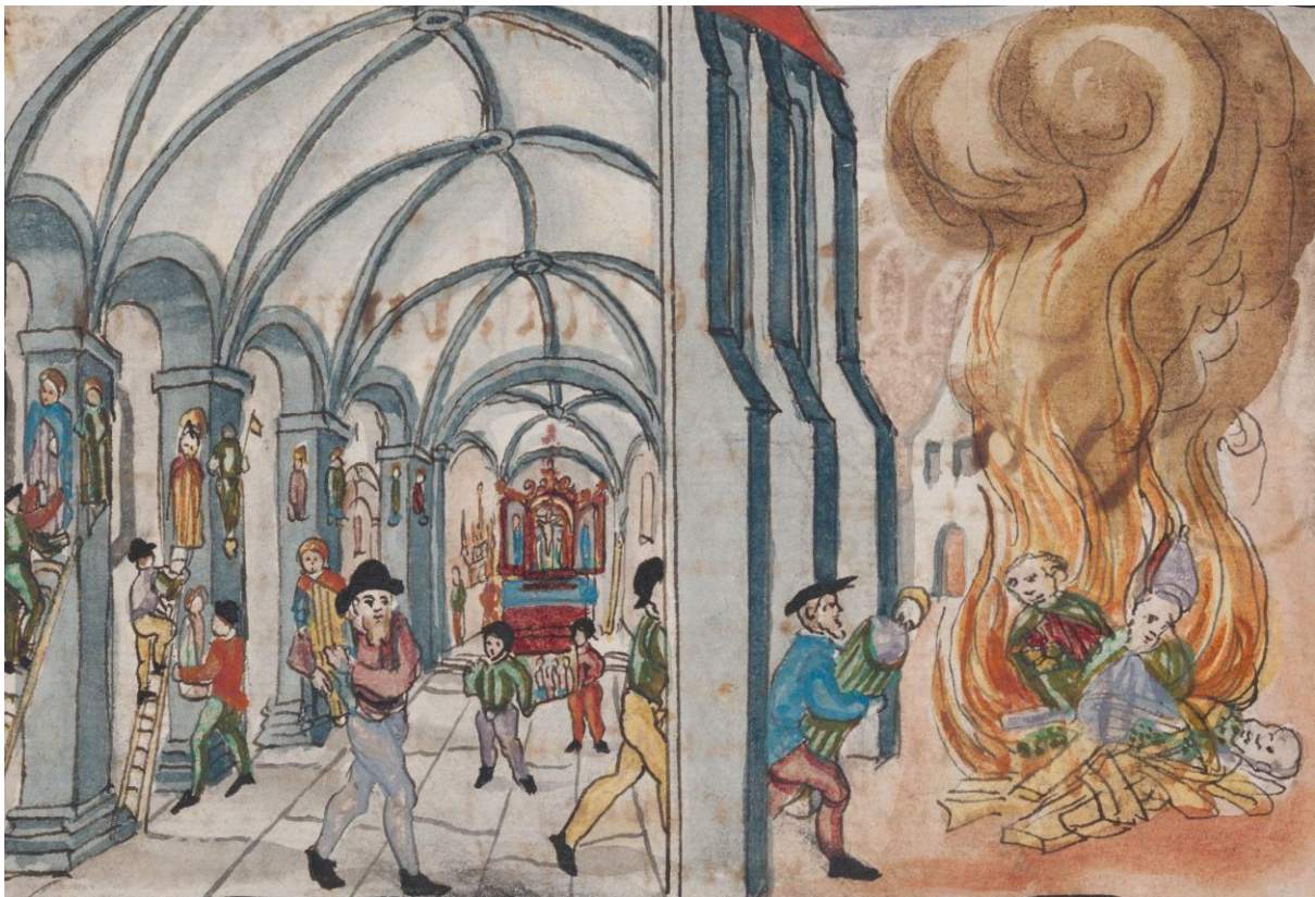
1 – «So hub man ouch Inn dem münster, unnd tat allenthalben die götzen hinweg [...]». Signatur: ZBZ, Ms B 316, Blatt 321 verso. ( Link )

Im Jahr 1528 reisen Ulrich Zwingli (1484-1531) und Heinrich Bullinger (1504-1575) in einer Zürcher Delegation nach Bern zur Disputation, also zur öffentlichen Verhandlung theologisch-kirchlicher Fragen, somit auch zum Umgang mit sakralen Kunstwerken. Im Jahr 1564 schreibt Bullinger eine Chronik zur zürcherischen Kirchen- und Reformationsgeschichte. Darin berichtet er auch über die Berner Vorgänge ausführlich. Wie unterschiedlich der Umgang mit Kirchenkunst während des Bildersturms war, zeigen die zwei folgenden Abschnitte.