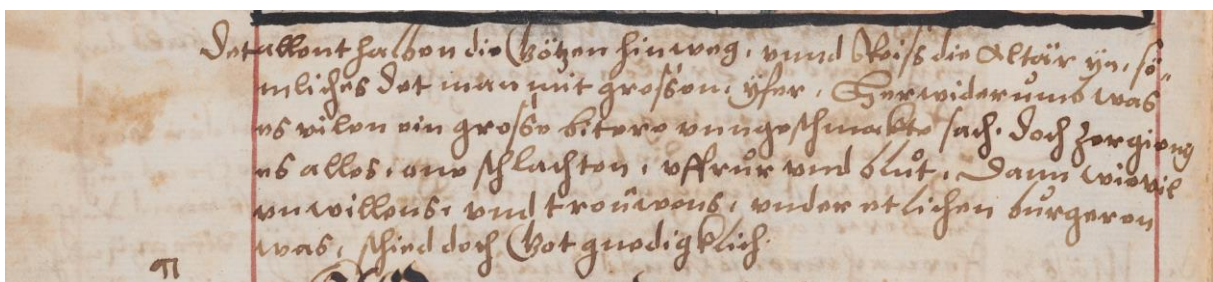
3 – [...] Reissend tafeln und / götzen herab [...]. Signatur: ZBZ, Ms B 316, Blatt 321 verso (Ausschnitt).

Die Schumacher hatend ein altar unnd bruderschaft bÿ / den baarfüsseren, dahin luffend sÿ. Reissend tafeln und / götzen herab, unnd verbrantends offentlich, bÿ und vor / der kilchen. So hüb man ouch Inn dem münster, unnd //